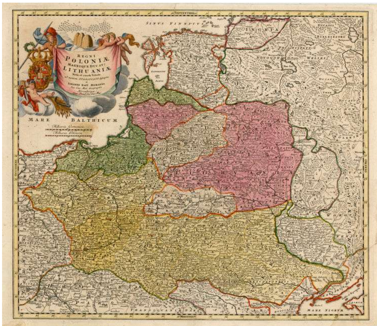
ATR, XVIII a.

Kad pakeistų nepalankią situaciją ATR viduje, vadovai ėmėsi įvairių sričių reformų plano. Viena pagrindinių reformų ir buvo nauja ATR Konstitucija, priimta ir pavadinta Gegužės 3-osios vardu. Lenkijos karalystė šią Konstituciją aiškiai palaikė, palaikė ją ir tuometinis Vilnius, nes Jis buvo tikras „unijos“ forpostas Lietuvoje, labai sulenkėjęs, nepriklausomas nuo lietuviškos periferijos miestas. Tačiau Vilnijos periferija, kaip ir visa Lietuva, tuomet buvo lietuviška, pasisakanti už LDK savarankiškumą provincija, todėl ir čia vykstantieji istoriniai procesai skyrėsi nuo tų, kurie vyko pačiame Vilniaus mieste. Katalikų Bažnyčia Vilniaus vyskupo Ignoto Jokūbo Masalskio, Verkių rūmų statytojo, Vilniaus katedros rekonstrukcijos fundatoriaus ir pirmojo Edukacinės komisijos pirmininko LDK teritorijoje asmenyje, prieštaraudama sulenkėjusių Lietuvos didikų iniciatyvai sulenkinti kraštą, ėmėsi nešališkų žingsnių, kad gyventojai savo vaikus galėtų mokyti Šv. Rašto gimtąja kalba. Mūsų žiniomis Vyskupo iniciatyva buvo steigiamos ir lietuviškos mokyklos, kurių